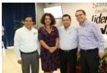
IEPC / INE